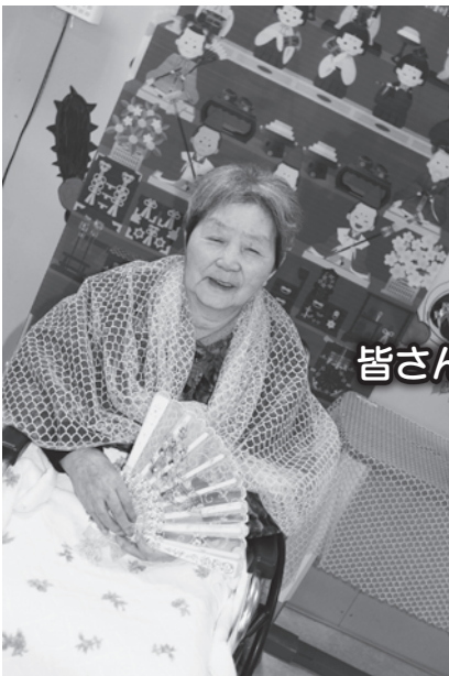
皆さんとても綺麗です

3月3日(木)、ひな祭り会が行われました。美味しいおやつを食べた後、記念撮影を行いました。皆さん素敵な笑顔を見せてくれました。