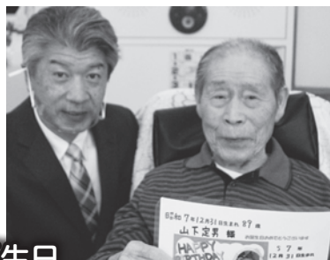
お誕生日 おめでとうございます!