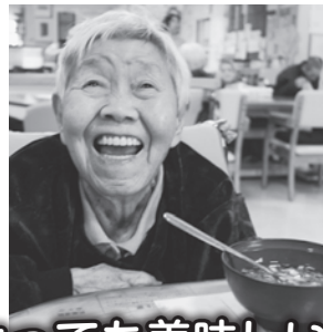
とっても美味しい!