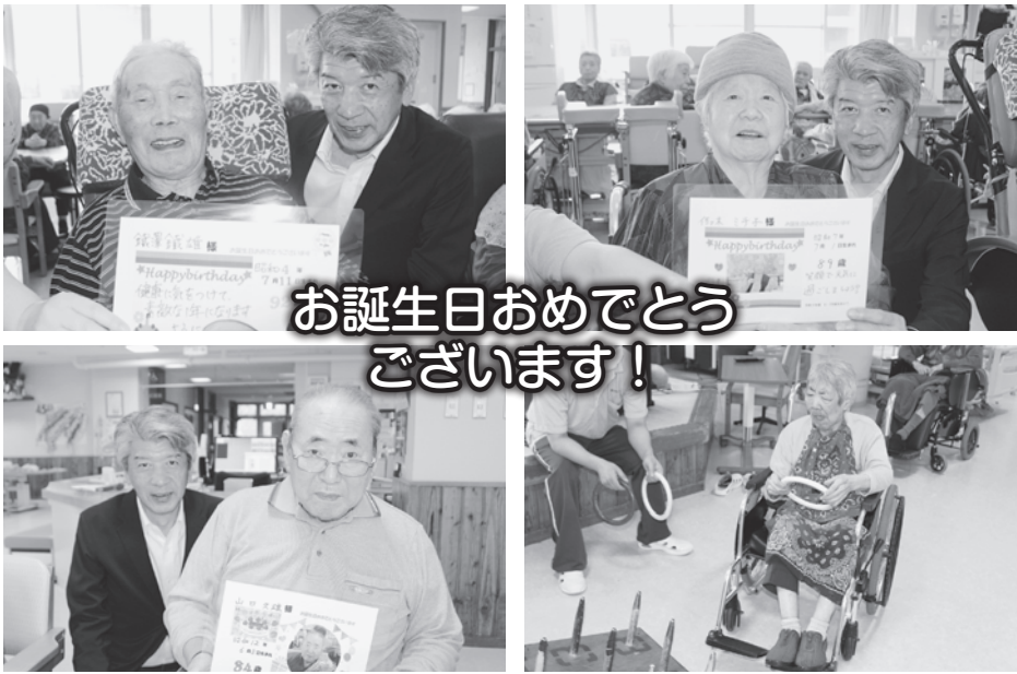
お誕生日おめでとうございます！

7月27日(火)、6月・7月合同誕生会が行われました。12名の誕生者の方のお祝いを盛大に行い、とても楽しい時間を過ごしました。美味しいケーキや歌と踊りを楽しんで、笑顔いっぱい誕生会になりました。