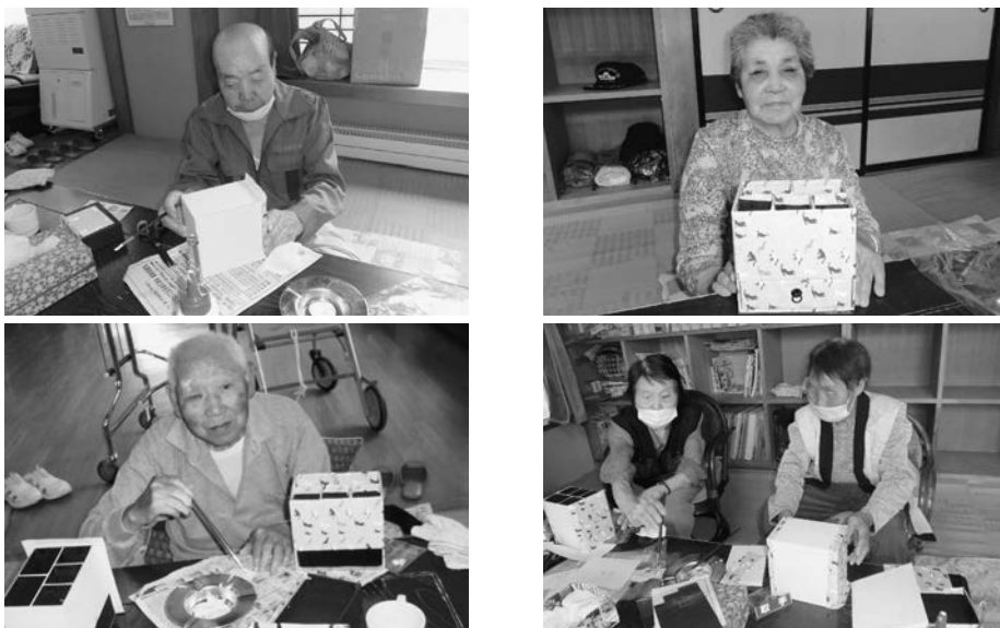
皆さん上手に出来上がりました。

7月26日(月)から2週間、手工芸で「便利道具箱」を作りました。いろいろ入れることが出来ると皆さん喜んで作っていました。