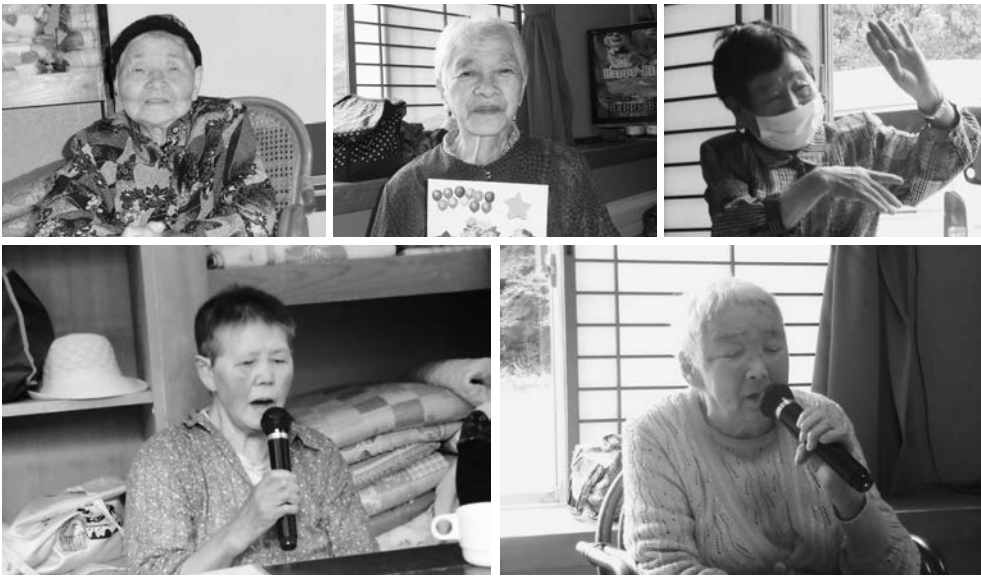
歌も踊りもすごく楽しめました☆

7月5日(月)から9日(金)まで、6月と7月生まれの方々の誕生会が行われました。カラオケもたくさん歌っていただき、とても盛り上がりました。