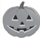
完成!! 思ったより うまくてきたぞ!