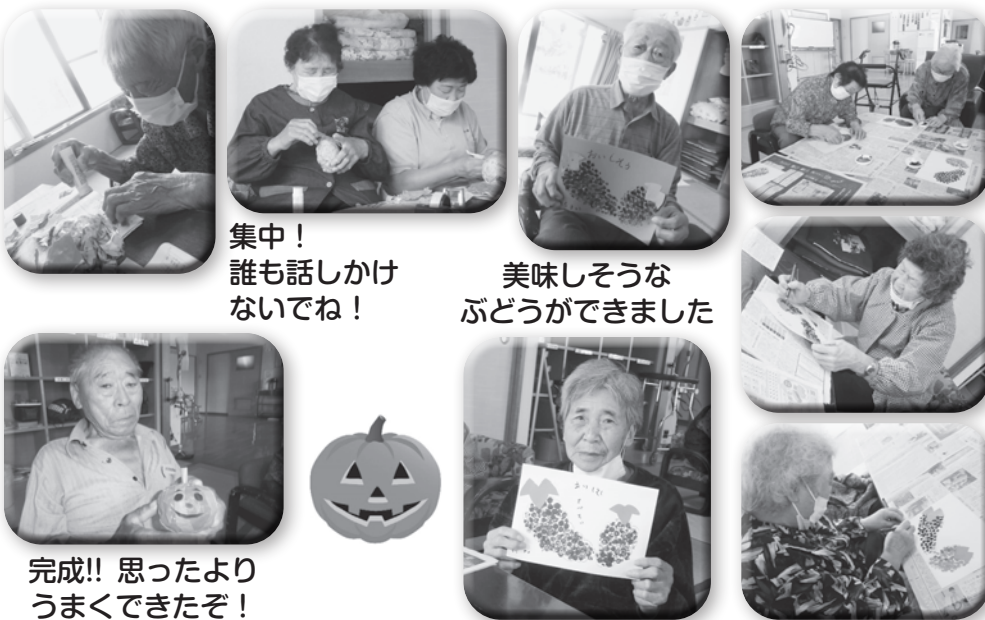
集中！ 誰も話しかけないでね！

8月30日(月)から9月10日(金)まで、文化祭に向けて作品制作を行いました。どんな作品ができるか、楽しみにしながら作成しました。